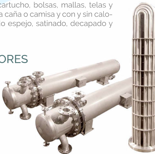
INTERCAMBIADORES DE CALOR